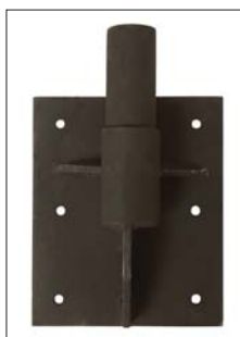
Suportes para piso e parede vendidos separadamente