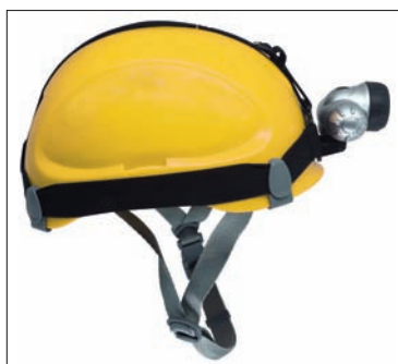
Clipes para instalação de lanterna