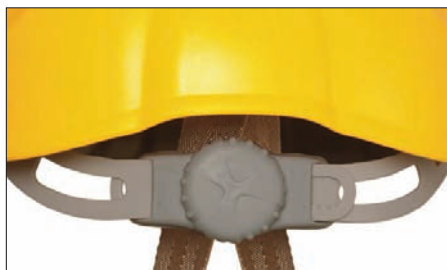
Sistema de ajuste perimetral