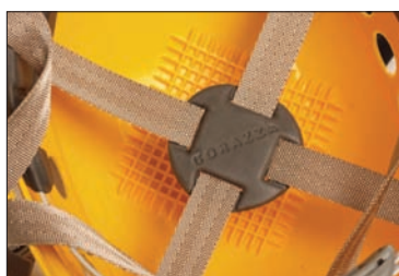
Acolchoado superior (coroa)