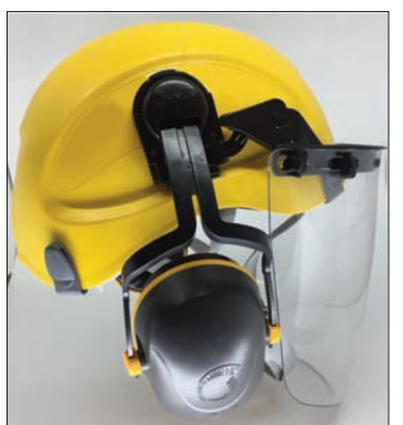
Slots (ranhuras) laterais para instalação de EPI

ATENÇÃO: Consulte sobre as marcas e/ou modelos de acessórios compatíveis com o capacete Corazza Air.