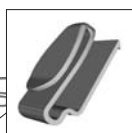
Clipes para lanterna