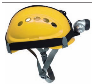
Clipes para instalação de lanterna