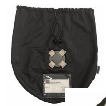
Bolsa telada para transporte (opcional)