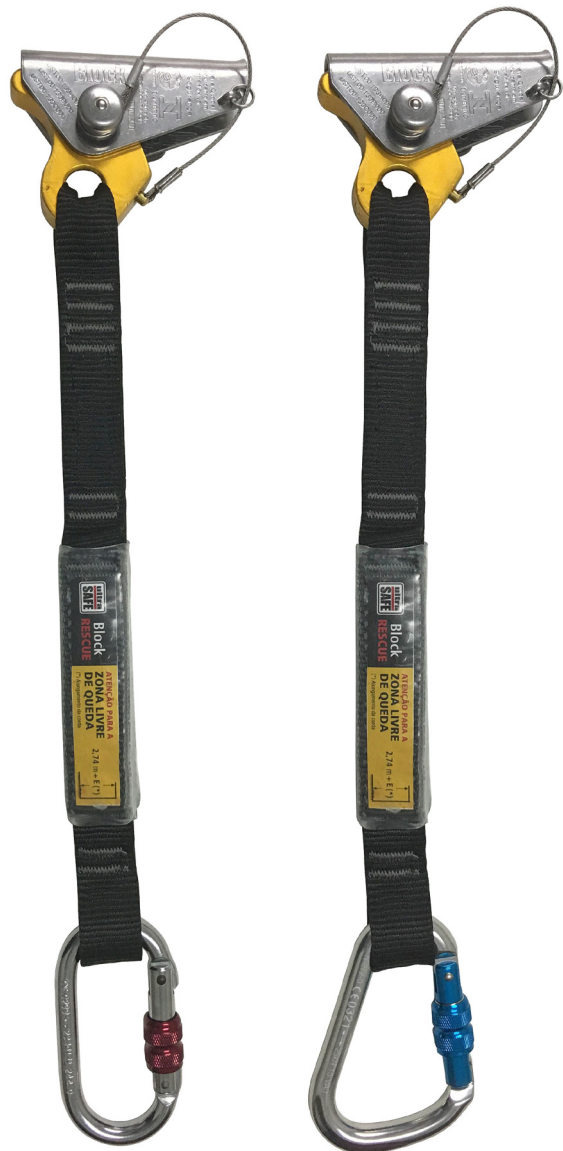
Mosq. Acero Oval