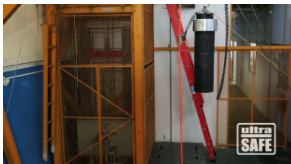
Masa de 200 kg / Factor de Queda 2