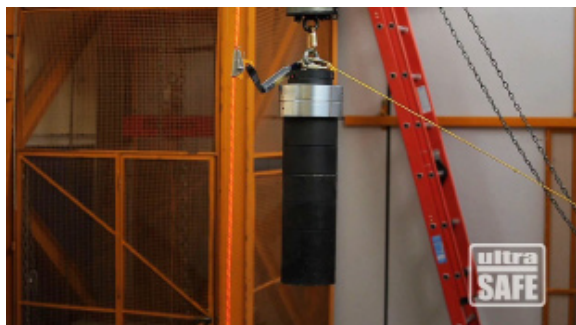
Masa de 200 kg / Factor de Queda 1