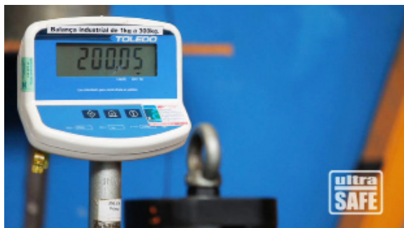
Masa de 200 kg