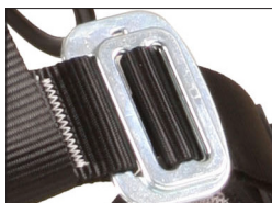
Fivela Fast Conect