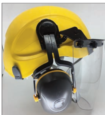
Slots (ranhuras) laterais para instalação de EPI