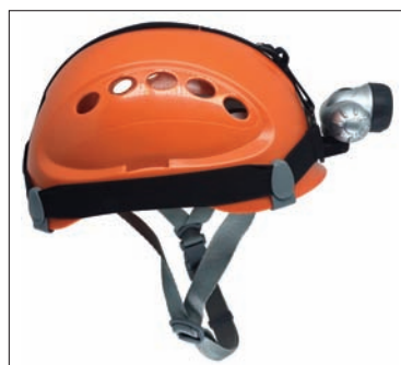
Clipes para instalação de lanterna