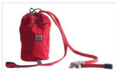
Bolsa de transporte con manijas