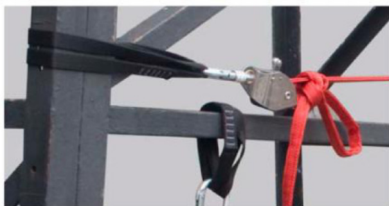
Línea de vida Giroline montada